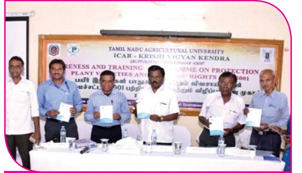
பாரம்பரிய தாவர இரகங்களின் பாதுகாப்பு மற்றும் உழவர்களுக்கான உரிமைச் சட்டம் விழிப்புணர்வு முகாம் - கையேடு வெளியிடுதல்