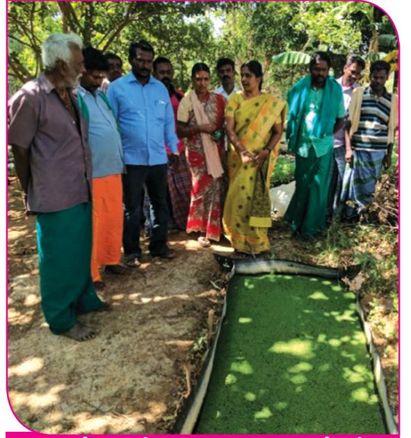
உழவர்களுக்கு அசோலா உற்பத்தி பயிற்சி வழங்குதல்

இந்திய வேளாண்மை ஆராய்ச்சி நிலையங்கள் மற்றும் வேளாண்மைப் பல்கலைக் கழகங்களின் ஆராய்ச்சி முடிவுகளின் அடிப்படையில் கண்டறியப்பட்ட புதிய பயிர் இரகங்கள், பண்ணைக் கருவிகள், உயர் விளைச்சல் தொழில் நுட்பங்கள் மற்றும் பயிர்ப் பாதுகாப்பு தொழில் நுட்பங்களை விவசாயிகளின் நிலத்திற்கு கொண்டு சேர்ப்பதே முதல் நிலை செயல் விளக்கத்தின் முக்கிய நோக்கமாகும். வேளாண்மை அறிவியல் நிலையம் கடந்த ஐந்தாண்டுகளில் 71 முதல் நிலை செயல் விளக்கங்கள் மூலம் விருதுநகர் மாவட்டத்தில் செயல்படுத்தப்பட்டுள்ளது. இதன் மூலம் புதிய தொழில் நுட்பங்களை செயல் முறை விளக்கமாக காண்பித்தும், அந்த தொழில் நுட்பத்தின் சிறப்புகளை மாவட்டத்தில் உள்ள பிற விவசாயிகளுக்கும், வேளாண் விரிவாக்கப் பணியாளர்களுக்கும், வயல் விழா மூலமாக எடுத்துரைத்தும், புதிய தொழில் நுட்பங்கள் குறித்த விழிப்புணர்வை இந்நிலையம் ஏற்படுத்தி வருகிறது.