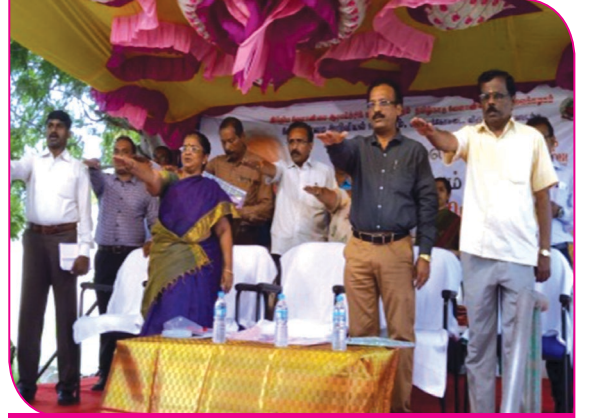
சபதம் மூலம் சாதிப்போம் நிகழ்ச்சி - உறுதிமொழி ஏற்றல்

விருதுநகர் மாவட்ட விவசாயிகள் பயன்பெறும் வகையில் நீடித்த நிலையான மண்வள மேலாண்மையை செயல்படுத்தும் நோக்கில் மண் மற்றும் பாசன நீர் ஆய்வு கூடம் நிறுவப்பட்டுள்ளது. மண் பரிசோதனையின் அவசியத்தை பற்றிய விழிப்புணர்வு