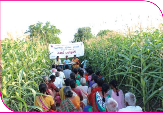
வீரிய ஓட்டு ரக மக்காச்சோளம் - ஒருங்கிணைந்த ஊட்டச்சத்து நிர்வாகம் களப்பயிற்சி