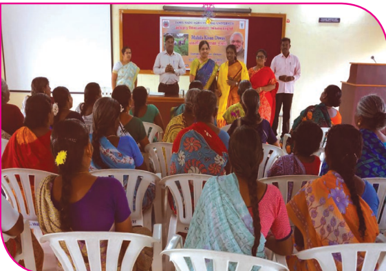
உலக மகளிர் தினம் - பண்ணை மகளிரை கவரவித்தல்