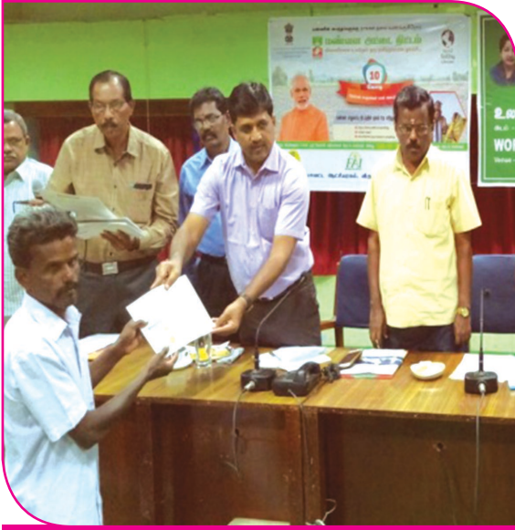
உலக மண் வள தீர்மானம் மாவட்ட ஆட்சித் தலைவர் விவசாயிகளுக்கு மண் வள அட்டை வழங்குதல்

முகாம்கள், மண் வளப் பாதுகாப்பு பயிற்சிகள் மாவட்டத்தின் பல பகுதிகளில் நடத்தப்பட்டு மண் மற்றும் நீர் மாதிரிகள் சேகரிக்கப்படுகிறது. மேலும், மண்பரிசோதனை அடிப்படையில் விவசாய நிலங்களின் பண்புகளையும், பிரச்சனைகளையும் கண்டறிந்து அதற்கேற்ற ஊட்டச்சத்து நிர்வாகம், பயிர் தேர்வு, நிவர்த்தி முறைகள் விவசாயிகளுக்கு வழங்கப்பட்டு வருகிறது. சென்ற ஆண்டு 265 மண் மாதிரிகள் ஆய்வு செய்யப்பட்டு மண்