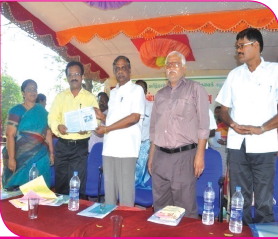
ரபி முன் பருவ விழிப்புணர்வு முகாம் துவக்க விழா

மானாவாரி விவசாயத்திற்கேற்ற பயறு வகைப் பயிர்களில் விருதுநகர் மாவட்டத்திற்கென உளுந்து, பாசிப்