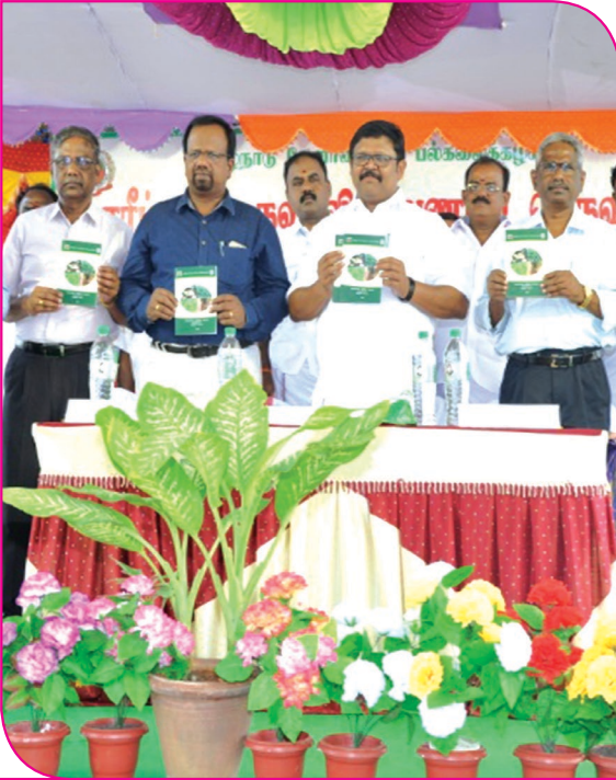
காரீப் முன்பருவ விழிப்புணர்வு முகாம் தொழில் நுட்ப புத்தகம் வெளியீடு

❖ பயிர் உற்பத்தியை அதிகரிக்கும் நவீன வேளாண் தொழில் நுட்பங்களைப் பற்றி விழிப்புணர்வு மற்றும் அறிவுசார் திறனை விவசாயிகளுக்கு வழங்கிட பட்டறிவு பயணங்கள், கண்காட்சிகள், கருத்தரங்குகள், ஆலோசனைகள், முகாம்கள், கருத்துப்பட்டரைகள், வானொலி மற்றும் ஊடக நிகழ்ச்சிகள், இணையதளம் சார்ந்த கணினி மற்றும் கைபேசி வாயிலான தகவல் பரிமாற்றங்கள் ஆகியவற்றை செயல்படுத்துதல்