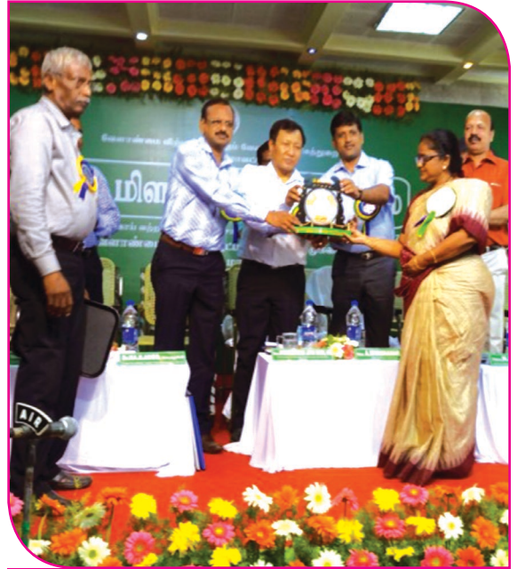
விருதுநகர் மாவட்ட வேளாண் வணிக துறை சார்பாக நடைபெற்ற மிளகாய் கருத்தரங்கு - சிறந்த கருத்துக் கண்காட்சிக்கான விருது பெறுதல்