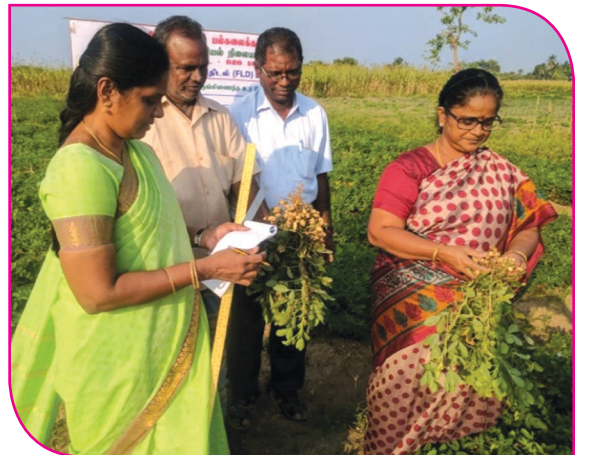
நிலக்கடலை முதல் நிலை செயல் விளக்கத் திடல் பார்வையிடல்