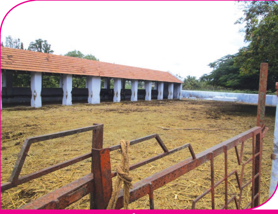
படம் - 1