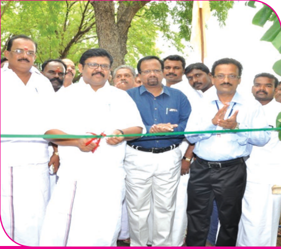
மாண்புமிகு முன்னாள் அருப்புக்கோட்டை சட்டமன்ற உறுப்பினர் அவர்கள் காரீப் முன்பருவ விழிப்புணர்வு விழா கருத்துக் காட்சிகளை துவக்கி வைத்தல்