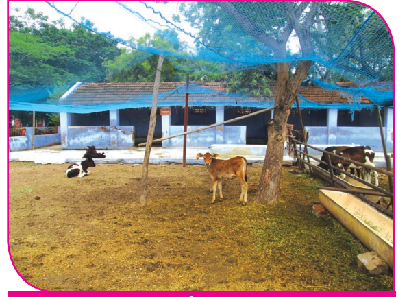
படம் - 2

இதனாலேயே பால் உற்பத்திக் குறைவு உண்டாகிறது. இது தவிர காலை, மாலை இரு வேளைகளில் கறவை மாடுகளின் மேல் நீரை தெளிக்க வேண்டும். தண்ணீர் வசதி அதிகமுள்ள பகுதிகளில் மாடுகளின் உடல் பகுதிக்கு மேல் நிரந்தர தெளிப்பான்களை பொருத்தலாம். வட மாநிலங்களில், ஈரமான சாக்கு பைகளை மாடுகளின் உடலில் போர்த்தி அதன்மேல் தொடர்ந்து தண்ணீர் ஊற்றுவது வழக்கமாக இருக்கிறது. நாமக்கல் கால்நடை மருத்துவக் கல்லூரியில் நடத்தப்பட்ட ஓர் ஆய்வில் இந்த நுண்நீர் தெளிப்பான் காற்றின் வெப்பத்தை குறைத்து ஈரப்பதத்தை ஓரளவு அதிகப்படுத்துவது கண்டறியப்பட்டது. கோழிகளுக்கு அதிக ஈரப்பதம் ஆகாது என்பால் இந்த நுண் தெளிப்பனை தொடர்ந்து இயக்காமல் முப்பது நிமிடங்களுக்கு ஒரு முறை இயக்குவது முட்டை உற்பத்தித் திறனை பாதிக்காமல் இருக்க உதவுகிறது. மேலும், கோழிகளுக்கு குளிர்ந்த நீர் கிடைக்காமல் போனால் முட்டை உற்பத்தி குறைவது மட்டுமின்றி இறப்பும் அதிகமாகும். ஆகவே, மேல்நிலை நீர்த் தொட்டிகளில் பெரிய ஐஸ் கட்டிகளை போட்டு அதன்மூலம் நீரின் வெப்பத்தை குறைப்பது நடைமுறையாகும்.